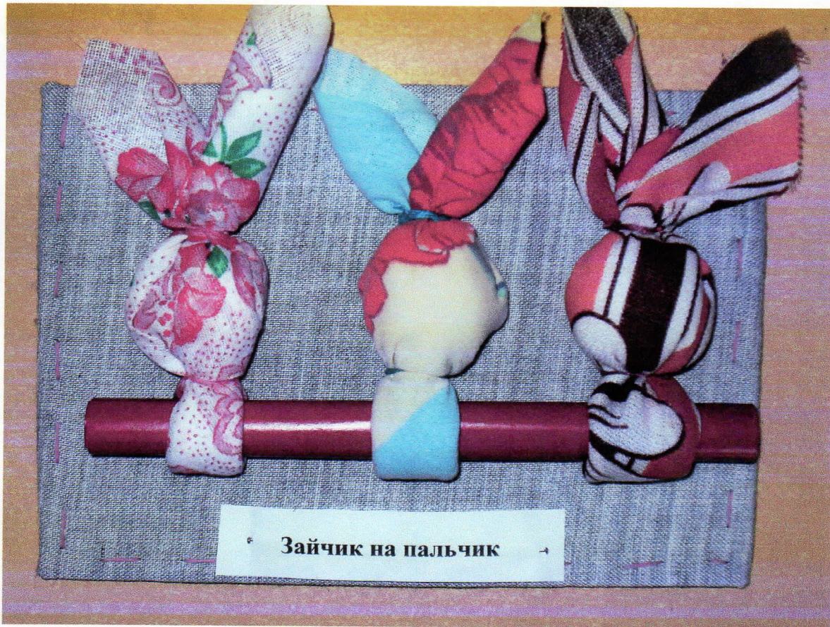
Зайчик на пальчик

Зайчик на пальчик делали или дарили ребенку от трех лет. Именно в этом возрасте родители начинали оставлять ребенка одного, и чтобы ему было не страшно, и было с кем играть, ему делали такого зайку (оберег от одиночества и страха). Зайчик легко одевается на пальчик и при движении ребёнком руками «оживает».