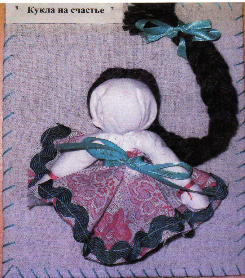
Кукла на счастье

Кукла "На счастье". Волосы издревле считались знаком женской силы, лишиться косы считалось позором. Поэтому главное в традиционной куколке "На счастье" - это ее толстая закрученная коса, кроме всего прочего, именно с ее помощью она твердо стоит на ногах. Если такую куколку дарят молодым супругам, то она словно маленькое семейное счастье, которое предстоит умножить и сохранить. Как свое счастье, так и эту куклу не выставляют на показ. Берут от постороннего взора.